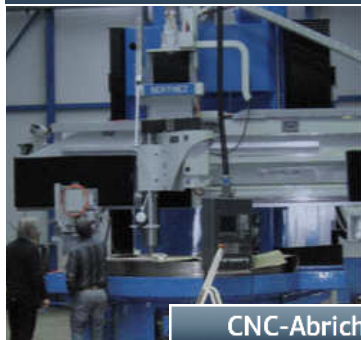
CNC-Abrichter Typ 358